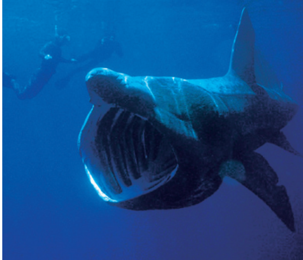
De reuzenhaai zwemt met zijn bek open om plankton te vangen.

Alleenstaand geval of niet? Pikant detail is dat hetzelfde vissersvaartuig, met een andere bemanning, in 2007 al eens een reuzenhaai van 2.000 kg in zijn geheel aan land bracht en