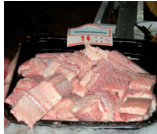
Haai wordt bij ons niet gesmaakt en dus liever verkocht als 'zeepaling'.

'De twee vinnen, de rugvin en een borstvin, behoorden toe aan een reuzenhaai, die de wetenschappelijke naam Cetorhinus maximus