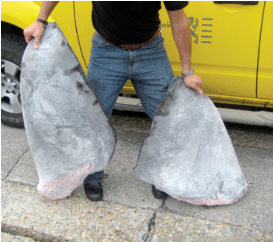
Afgesneden haaienvinnen: ook op een Belgische visserboot aangetroffen.

De reuzenhaai is niet de enige haaiensoort die bedreigd is. Voor heel wat haaiensoorten zou de vangst tientallen jaren lang moet worden gestopt om de populaties de kans te geven